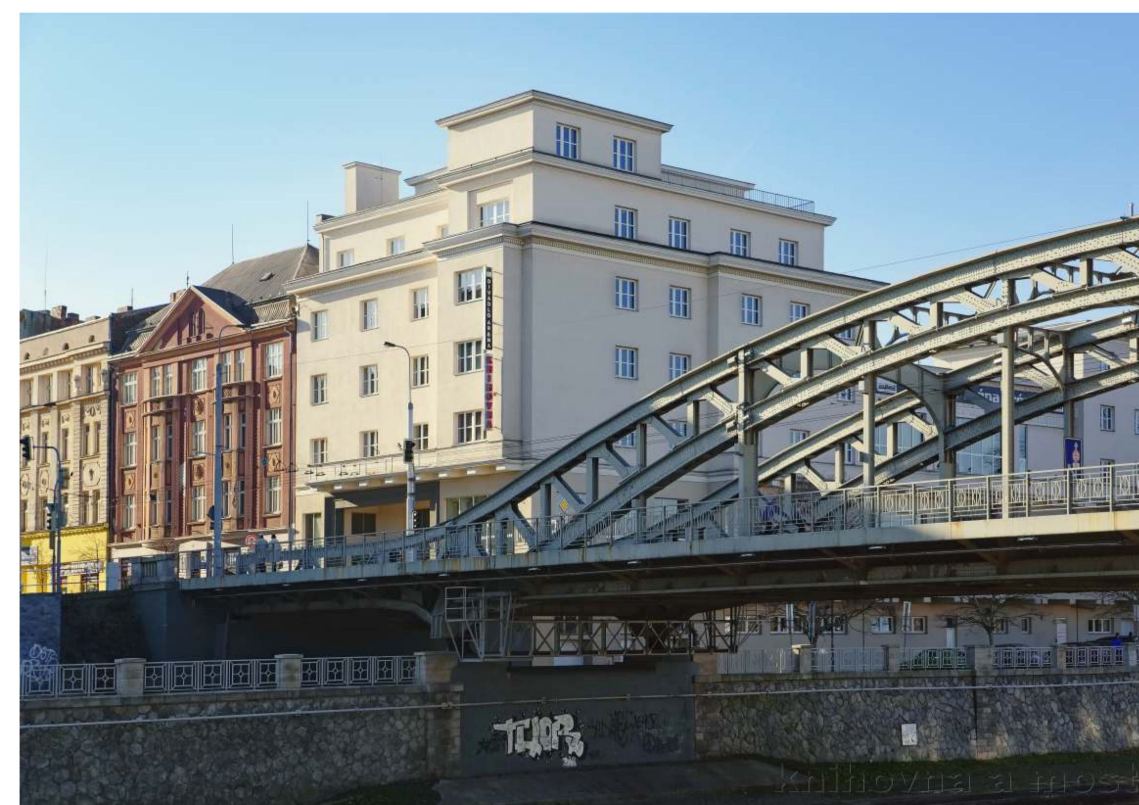
Obr. 6: Obytný a obchodní dům v Moravské Ostravě (1928), dnešní stav – v budově dnes sídlí mimo jiné Knihovna města Ostravy