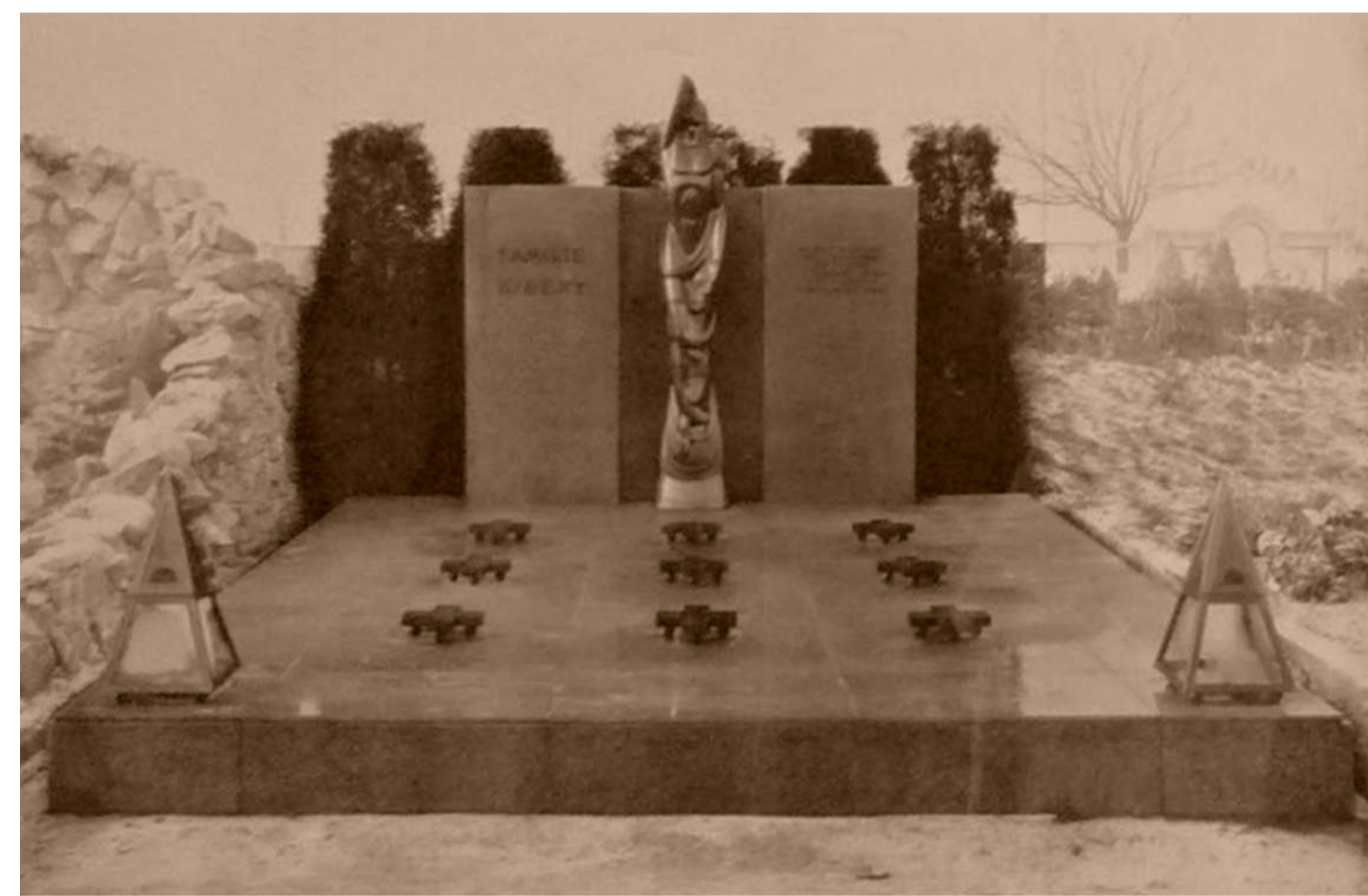
Obr. 4: Hrobka rodiny Kidery, Vítkovice, 1928, stav bezprostředně po stavbě, hrobka se do současnosti nedochovala