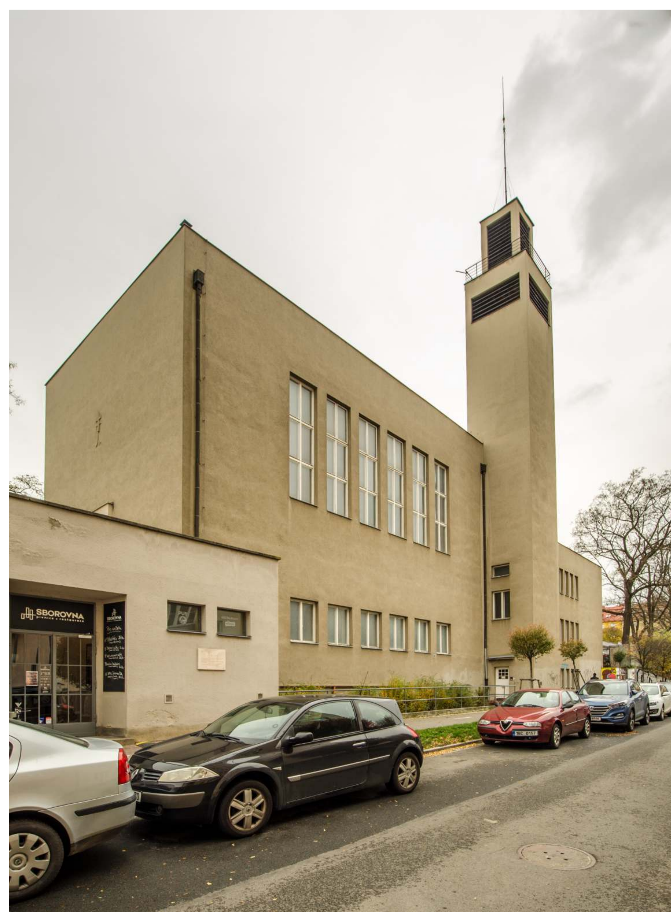
Obr. 3: Husův sbor církve československé (1926–1928), Brno, současný stav