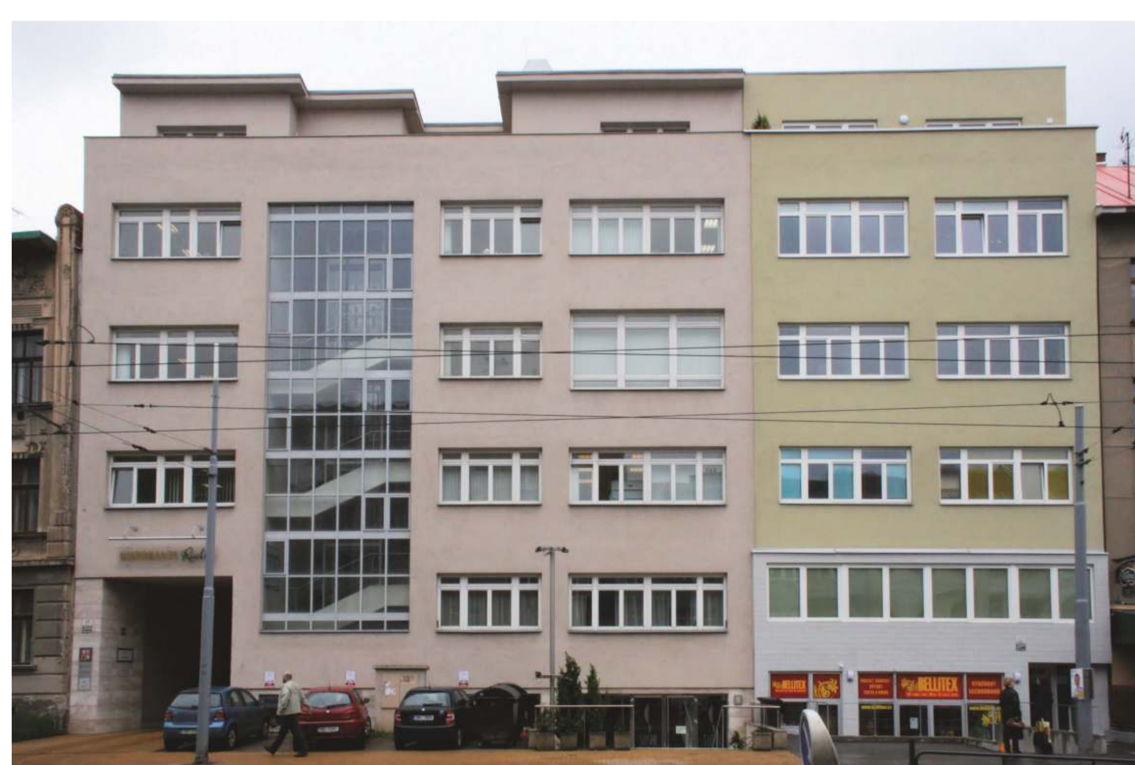
Obr. 2: Sanatorium Dr. Šilhana (1929–1935), Brno, současný stav